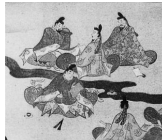
年中行事図巻(部分・三月)細見美術館蔵